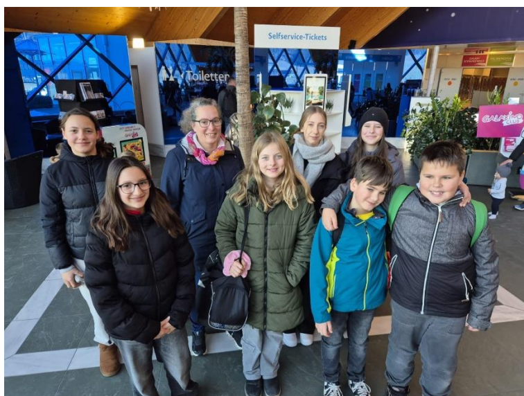
Ministrantenausflug ins „TuWass“ Tuttlingen