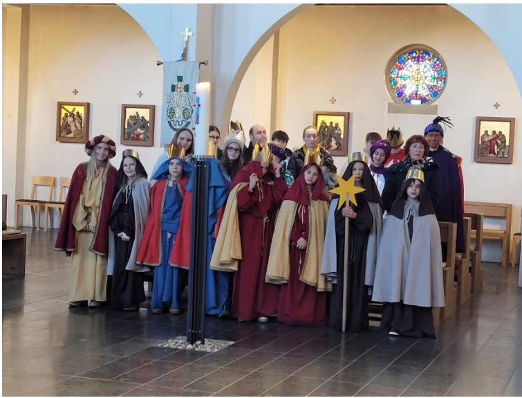
Gottesdienst mit Aussendung aller Sternsinger am 04.01.2026