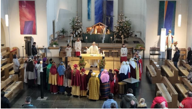
Gottesdienst mit Aussendung aller Sternsinger am 05.01.2025