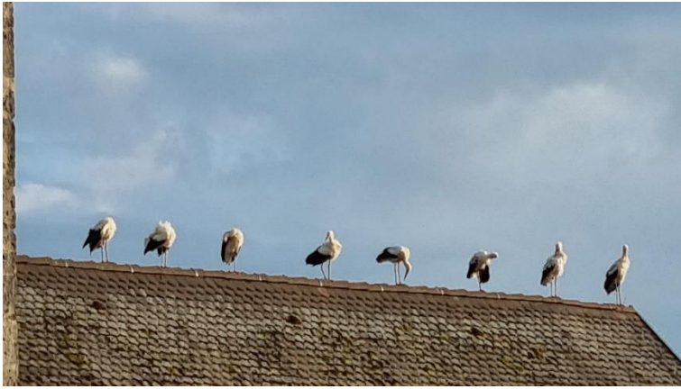
Storcheninvasion auf dem Kirchendach