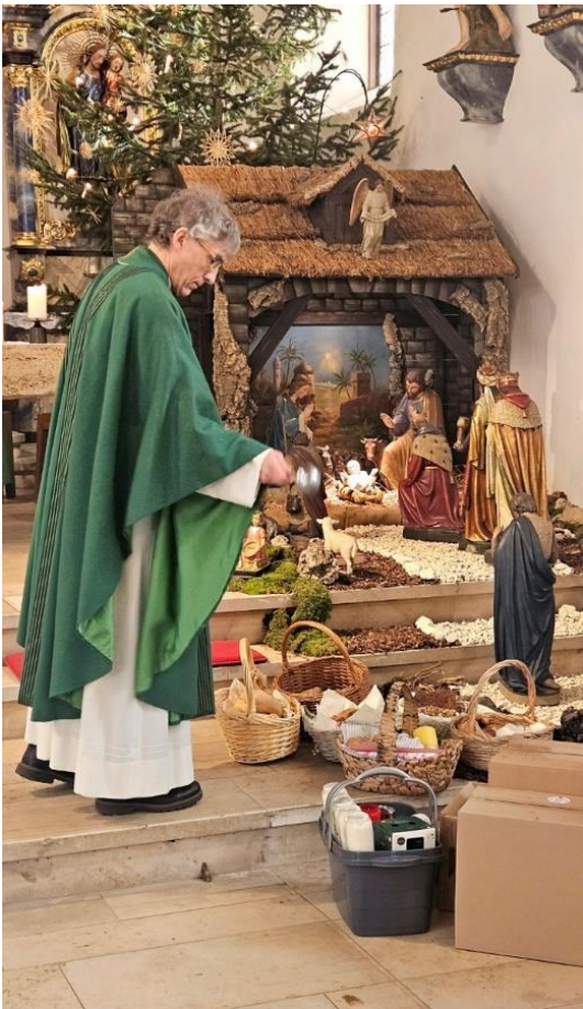
Kerzenweihe und Segnung des Agatha-Brottes